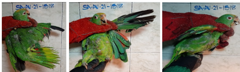
Fotos 5 a 7. SA-AV-21-1518 Lora real, especie Amazona ochrocephala , 08-08-2021.

Valoración técnica inicial del espécimen SA-AV-21-1518: ejemplar vivo, edad adulto joven, sexo indeterminado, temperamento dócil, actitud alerta, presentaba habituamiento y vocalización anormal, condición corporal 4/5, hidratación normal, con lesiones de mutilación por recorte de plumas de miembro superior izquierdo. (...)