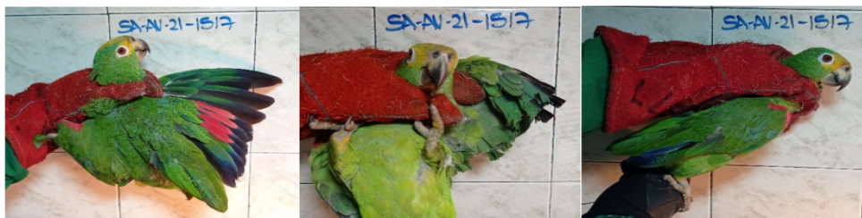
Foto 2 a 4. SA-AV-21-1517 Lora real, especie Amazona ochrocephala , 08-08-2021.

Valoración técnica inicial del espécimen SA-AV-21-1517: ejemplar vivo, edad adulto joven, sexo indeterminado, temperamento nervioso, actitud alerta, presentaba habituamiento y vocalización anormal, condición corporal 4/5, hidratación normal, con mutilación en ambos miembros superiores por recorte de plumas.